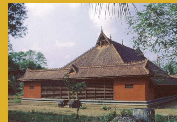
Der Kuttambalam des Kalamandalam-Institutes in Cheruthuruthy wurde alten Vorbildern entsprechend nachgebaut.

1912 entdeckte der indische Gelehrte Ganapati Shastri in Travancore 13 auf Palmblätter geschriebene Sanskritdramen (als »Trivandrum-Stücke« bezeichnet). Die ältesten Blätter dieses Fundes sind um die 400 Jahre alt. Die darauf festgehaltenen Dramen zählen zum Repertoire des Kutiyattam und werden Bhasa zugeschrieben. Bhasas überaus geistreiche Dramen kreisen hauptsächlich um Figuren, die den hinduistischen Epen des Mahabharata und Ramayana entnommen sind.